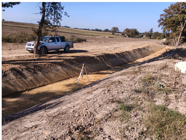
Fossé a redents

Les techniciens du Département et du Syndicat ont également été présents lors de la phase de travaux qui a duré tout le mois d'octobre.