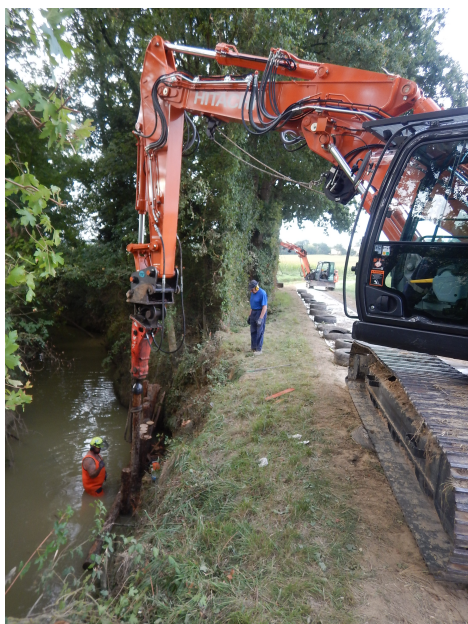
Enfoncement des pieux de châtaigniers